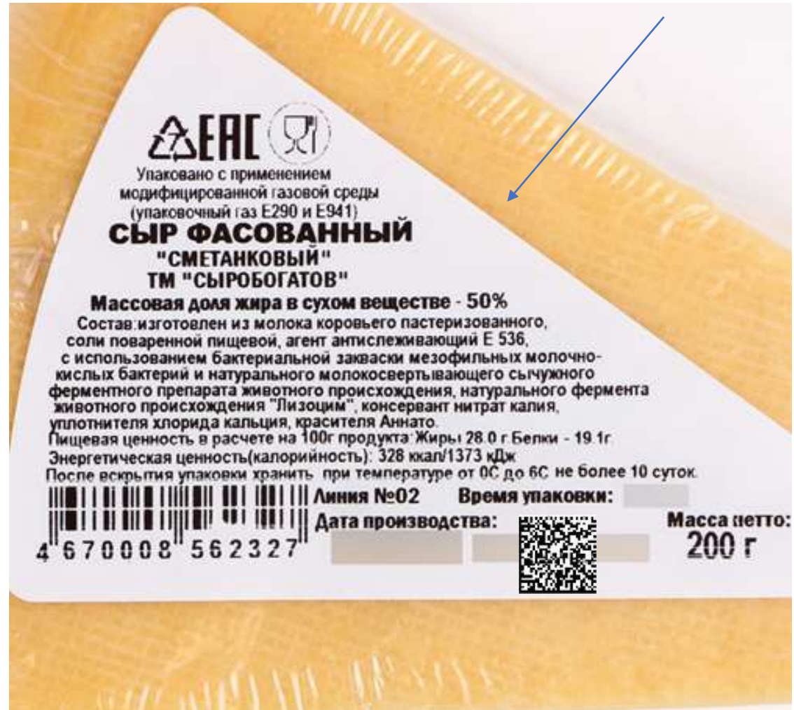
Весовой товар с КМ

Этикетка полностью напечатана на принтере