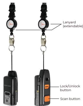
Переходник USB-C (можно использовать с ремешком)

Некоторые функции могут быть доступны не во всех регионах.